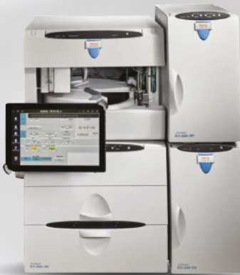
Sistema de HPIC ICS-6000 DUAL CHANNEL