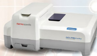
Espectrofotómetro Evolution ONE™