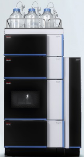
Sistema VANQUISH DUO: dos trayectorias de solvente independientes en el mismo espacio de mesada