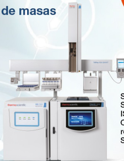
Sistema de GC-MS de SIMPLE CUADRUPOLO ISQ 7610. Con automuestreador robótico TRIPLUS RSH SMART