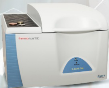
Espectrómetro de Fluorescencia de Rayos X QUANT'X™