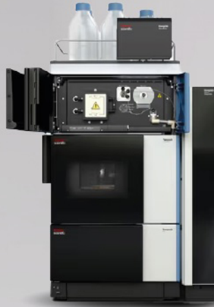
Sistema de UHPLC VANQUISH FLEX con detector de aerosoles cargados (CAD) Vanquish - P Series