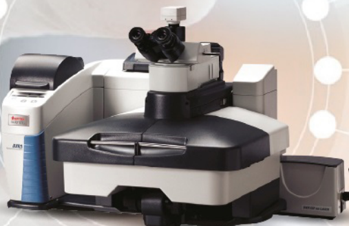
Microscopio Raman DXR3