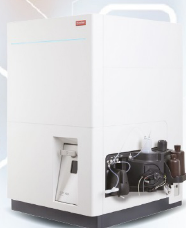
ICP-MS iCAP MSX™