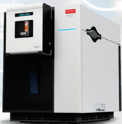
Orbitrap Excedion Pro