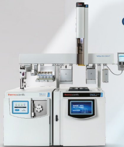
Sistema de cromatografía gaseosa TRACE 1610. Con automuestreador HEAD SPACE TRIPLUS 500