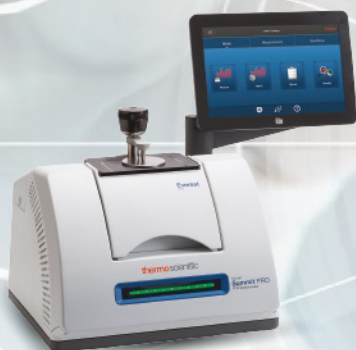
Espectrómetro FTIR Thermo Scientific Nicolet™ Summit™