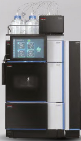
Sistema de HPLC VANQUISH CORE con detector de arreglo de diodos